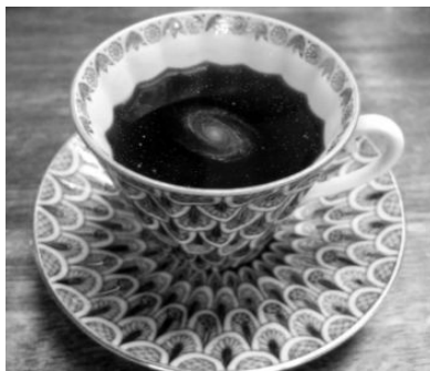
Laurits Nymand Svendsen The Un-Terrestrial Tea Room , 2012 Repræsentation af drømmeværk