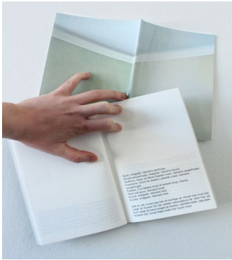
Line Hvidbjerg Synkope, 2012 Bog, 42 sider