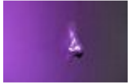
Malte Klagenberg Uden titel, 2013 Akryl på træ, 100 cm * 100 cm